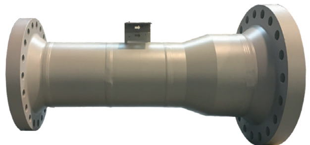
FLC-RO-MS型多级节流孔板, 带变径